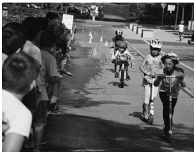
Fahrradparade des KG Muntlix