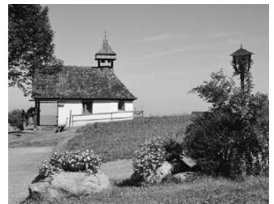
Kapelle in Furx