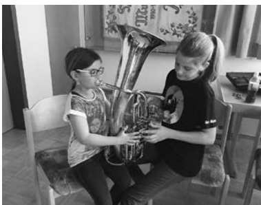
Fleißig beim Ausprobieren

Traditionell fand am 21.04.2016 wieder die Jungmusikanten-Werbung in unserem Musikheim in Muntlix statt. Die Zwischenwässler Kinder und Erwachsenen hatten die Möglichkeit, das breite Spektrum an Musikinstrumenten in der Blasmusik zu testen um eventuell die Liebe zur Musik zu entdecken.