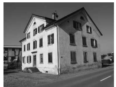
Armenhaus in Muntlix