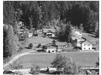
Ferienhäuser in Furx