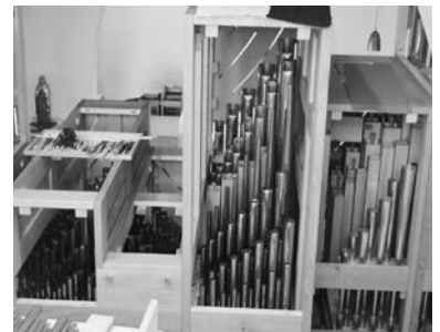
Orgelpfeifen werden in Schuss gebracht