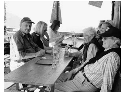
gemütlicher Hock nach Bergfrühstück