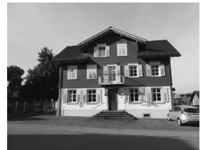
Geschäftsstelle LEADER in Rankweil