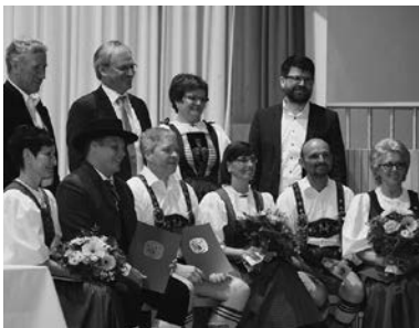
Ehrung in Hittisau

Wenn du Lust hast, bei uns mitzumachen, dann melde dich bei einem unserer Mitglieder oder komm einfach zu unserer offenen Probe!