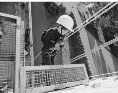
Besuch bei der Bergrettung Rankweil

Löschgruppe, organisierten einen Elternabend mit einer Action-Probe und vieles mehr.