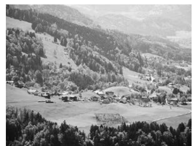
Blick auf Dafins