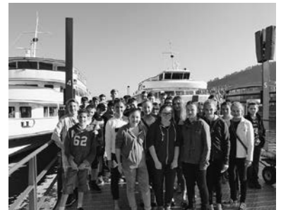
Fahrt nach Lindau