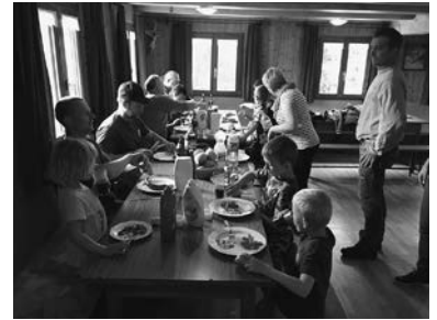
Hüttengaudi & Abendessen