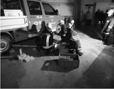
Action Probe beim Elternabend