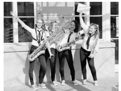
so sehen Sieger aus