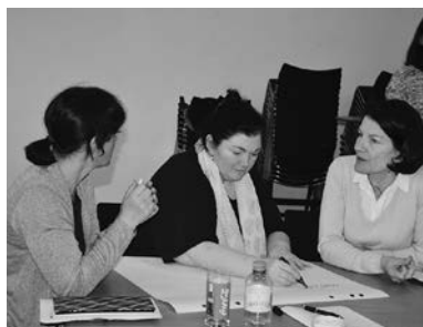
Arbeitsitzung mit dem Projektteam