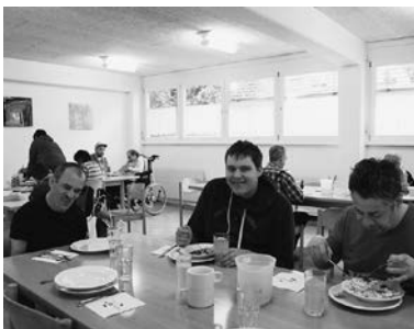
in der neuen „Lebensküche“