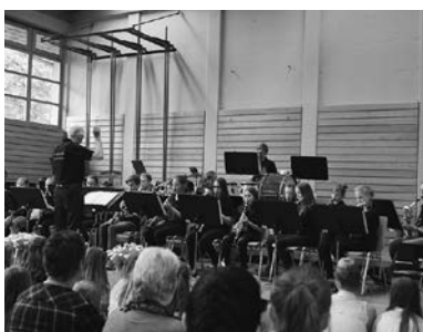
Auftritt der JungmusikantInnen

Wir hoffen, dass wir den einen oder anderen mit unserer Instrumentenvorstellung begeistern konnten und wir uns vielleicht bald über neuen Nachwuchs freuen dürfen.