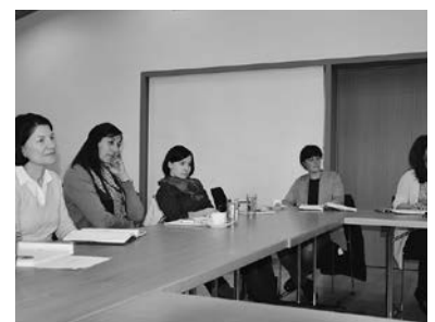
Arbeitssitzung mit dem Projektteam