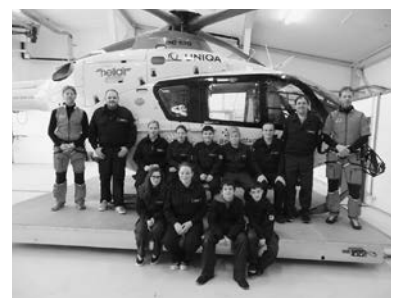
Besuch beim Hubschrauberstützpunkt C8