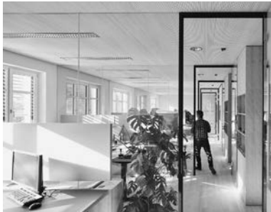
Büros im Obergeschoss