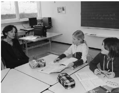
Gespräch mit SchülerInnen aus Laterns