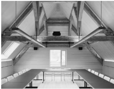
Sitzungszimmer Frutz im Dachgeschoss