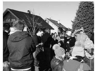
gemeinsamer Marsch nach Buchebrunnen