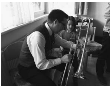
Vorstellung der Posaune

Drei Kinder aus Muntlix und zwei Kinder aus Dafins ließen es sich anschließend nicht nehmen, sich gleich bei der Musikschule in Rankweil auf der Klarinette, Trompete, Posaune bzw. auf dem Saxophon anzumelden.