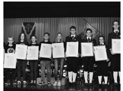
AbsolventInnen mit den Abzeichen