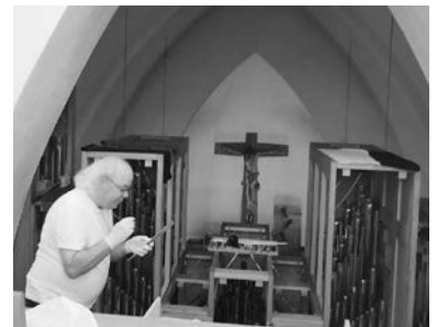
genaues Arbeiten ist gefragt