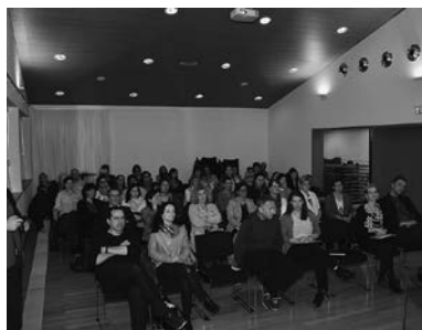
Aufaktveranstaltung im Pfarrsaal

TIPP: Erstinformationen für potenzielle Projektantragssteller gibt es auf der übersichtlichen Webseite. Ein detaillierter Leitfaden für die Projekteinreichung steht zum Download bereit – er beantwortet fast alle Fragen und hilft beim Einstieg in den EU-Fördertopf.