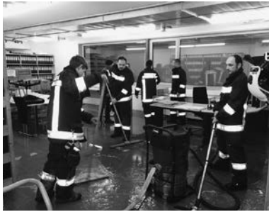
Wasser im Keller des KG Muntlix