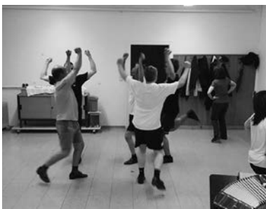
Probe für jedermann

Weitere Infos gibt es auf unserer Homepage www.schuhplattlergruppe.at und auf unserer Facebook Seite „Schuhplattlergruppe Zwischenwasser“.