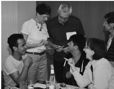
Spielerisch wird die deutsche Sprache vermittelt