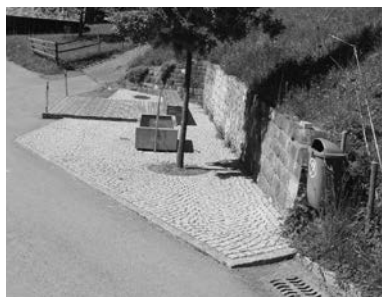
Dorfplatz in Suldis