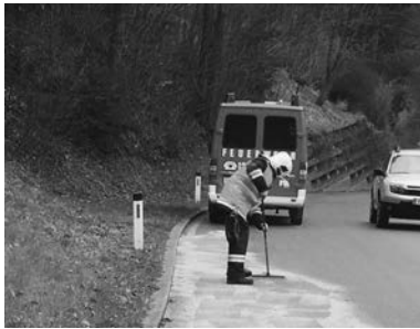
Ölspur Laterner Straße

Bis dato (03.06.2016) hatten wir 13 Einsätze. Bilder und weitere Informationen finden Sie unter „ www.of-zwischenwasser.at “ oder auf Facebook unter „Ortsfeuerwehr Zwischenwasser“.