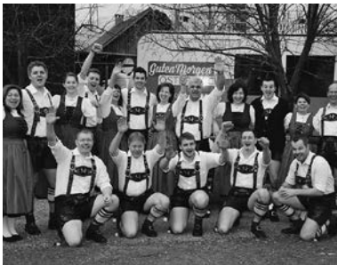
ORF - Auftritt