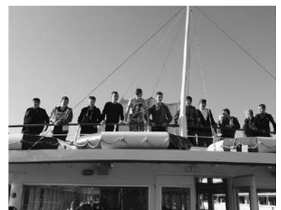
Kapitäne auf der „Vorarlberg“