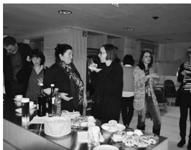
Gemütlicher und kommunikativer Ausklang

Infos, Termine und wichtige Unterlagen gibt es auf der Webseite der LEADER-Region www.leader-vwb.at