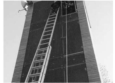
Abseilübung vom Schlauchturm