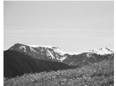
Furx mit Blick zum Hohen Freschen

Kilian Tschabrun, Bürgermeister