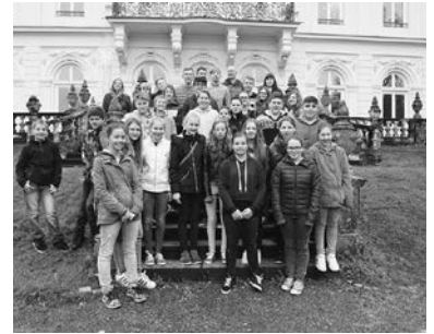
Drittklässler vor der Villa Raczynski

Bereits zum 4. Mal hintereinander gewannen die Turner der NMS Zwischenwasser die Landesmeisterschaften im Geräteturnen und waren somit die Vertreter Vorarlbergs bei den Bundesmeisterschaften, die heuer in Schärding in Oberösterreich ausgetragen wurden.