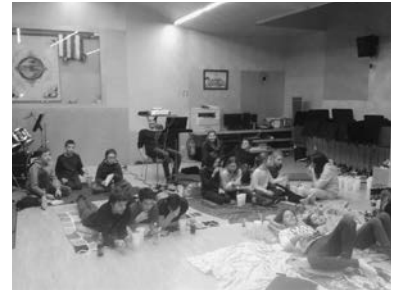
Filmabend „Dumm und Dümmer“