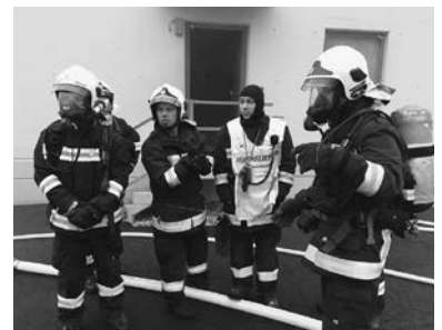
Heißbrandausbildung in neuer Übungsanlage