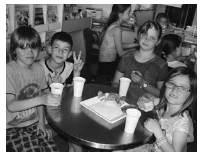
Die Jause schmeckt!