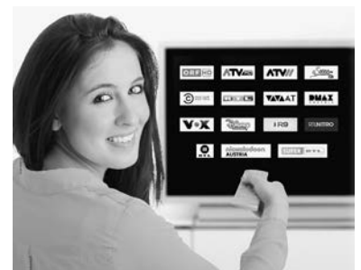
Lieblingssender auf Knopfdruck

Um die neue Programmvielzahl in ihrer ganzen Breite mit den neuen HD-Sendern aus Österreich nutzen zu können, muss ein Update Ihres TV-Gerätes oder des HD-Sat-Receiver durchgeföhrt werden.