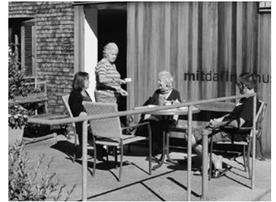
gemeinsam schmeckt Kaffee besser