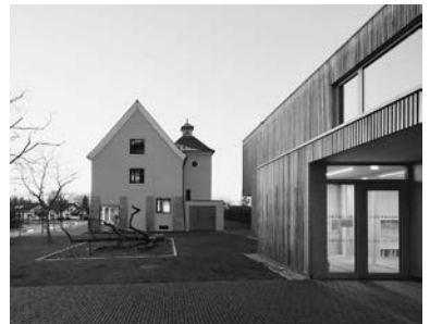
Gemeindeamt mit Kindergarten