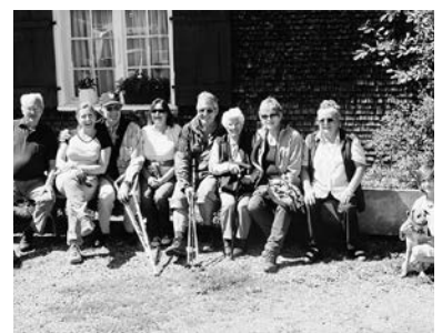
Ausflug auf den Alpwegkopf