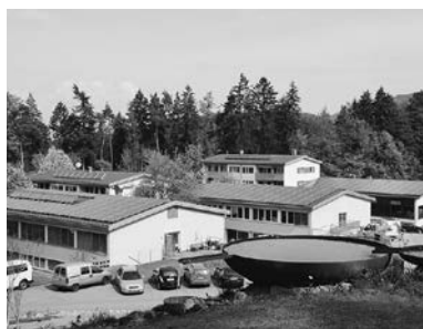
PV-Anlage Lebenshilfe Batschuns