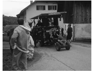
Faschingswagen im neuen Glanz