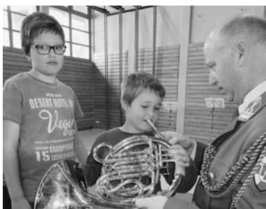
Ausprobieren der Instrumente