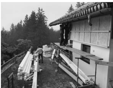
Isolierung und Abdichtung