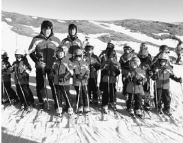
noch reicht der Schnee

Die Kinder- und Schülerläufer haben auch schon sehr gute Leistungen gezeigt und kommen den Bestzeiten immer näher. Das verspricht spannende Duelle für die Zukunft.